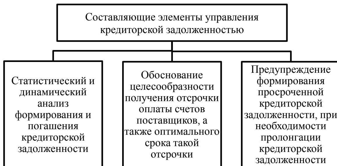
Рис. 2. Составляющие элементы модели управления кредиторской задолженностью*