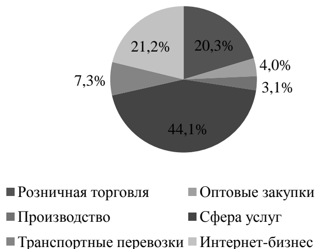
Рис. 2. – Зависимость выбора отрасли бизнеса от пола респондента (женщины)

Первостепенное значение для жизнеспособности любого бизнеса имеют источники финансирования. На вопрос о том, где искать стартовый капитал, подавляющее большинство респондентов ответило вполне предсказуемо – в начало своего дела лучше вкладывать собственные средства (223 человека). Вместе с тем, приоритетность поиска инвесторов, берущих на себя все риски по потере капитала, отметили 72 человека. Показательно, что вариант «субсидии от государства» выбрали лишь 6 опрошенных. К сожалению, сказанное косвенно отображает недостаточность развития области отечествен-