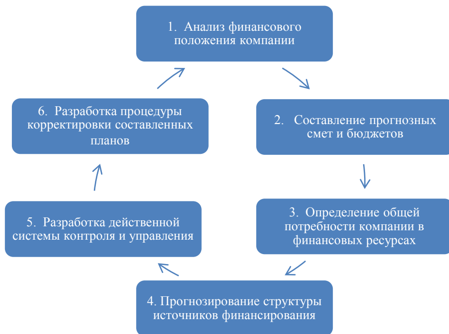
Рис. 2 – Основные этапы финансового планирования

Благодаря финансовому планированию организация получает следующие преимущества: