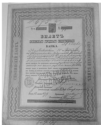
Рисунок 3 – Билет Скопинского городского общественного банка

Для привлечения новых вкладчиков Рыков выпустил процентные бумаги банка по вкладам. Они не были обеспечены капиталом банка и не имели правительственной гарантии. Но влиятельная фамилия во многом способствовала доверию клиентов банка. Бумаги охотно покупались и продавались, и новые жертвы вкладывали свои сбережения в Скопинский народный банк (рис. 3).