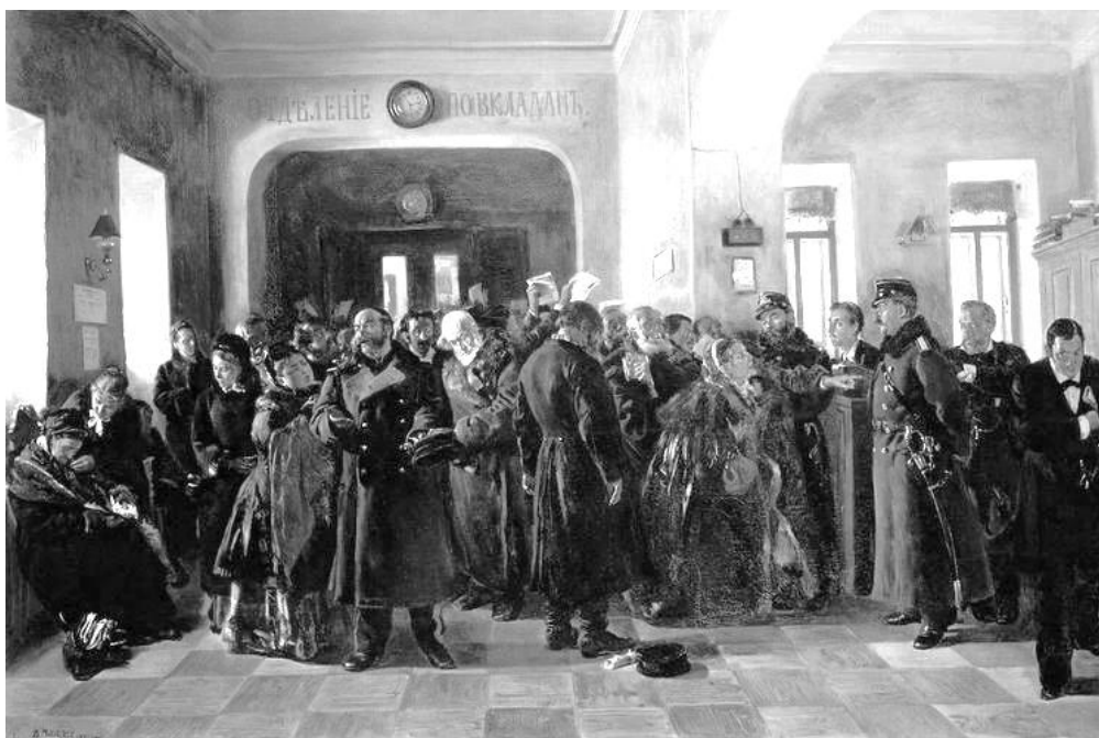
Рисунок 4 – Маковский В.Е. «Крах банка»

Выражение «рыковское дело» стало нарицательным. Константин Маковский написал картину «Крах банка», где отложились его впечатления о разорении Московского ссудного и Скопинского банков – это были два самых громких финансовых дела по тем временам (рис. 4).