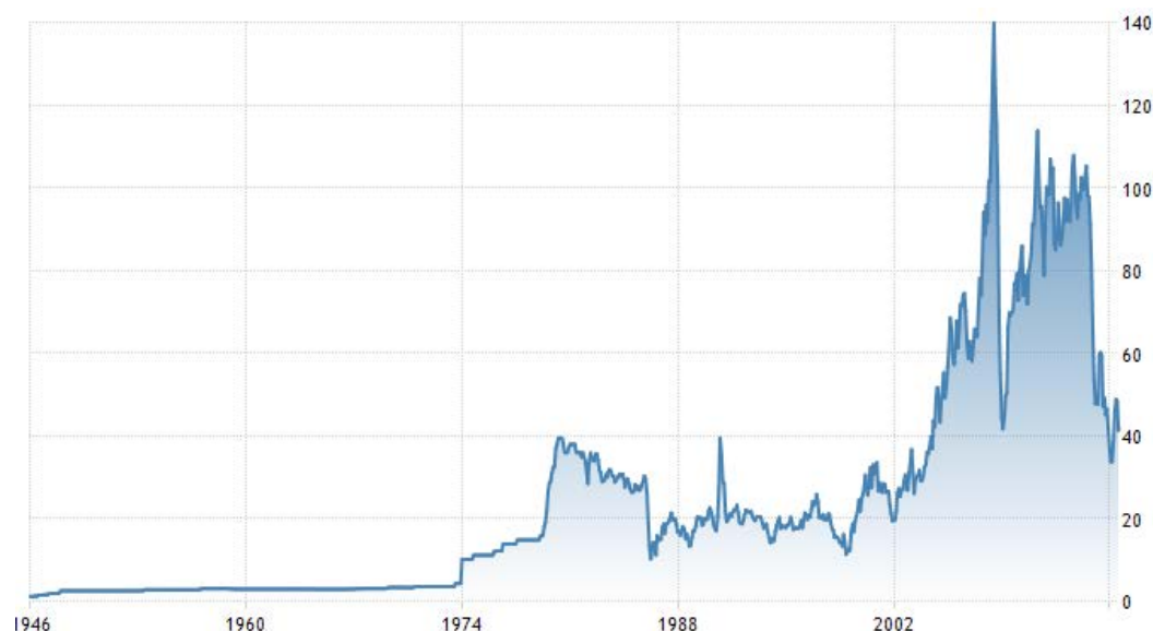
Рис. 1 – Историческая динамика цен на сырую фьючерсную нефть с 1946 г. (данные с сайта ru.tradingeconomics.com )

факту же, цена на нефть опускалась в 2015 году ниже 40 долларов за баррель. Данное обстоятельство говорит о том, что существуют и другие, неэкономические, факторы падения цен на нефть.