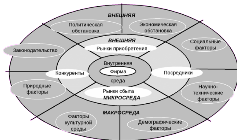
Рис.1. - Среда организации [4]

На рисунке 1 представлена схема среды организации, визуальную представленную в виде трех сфер, которую приводит Полутова М.А.