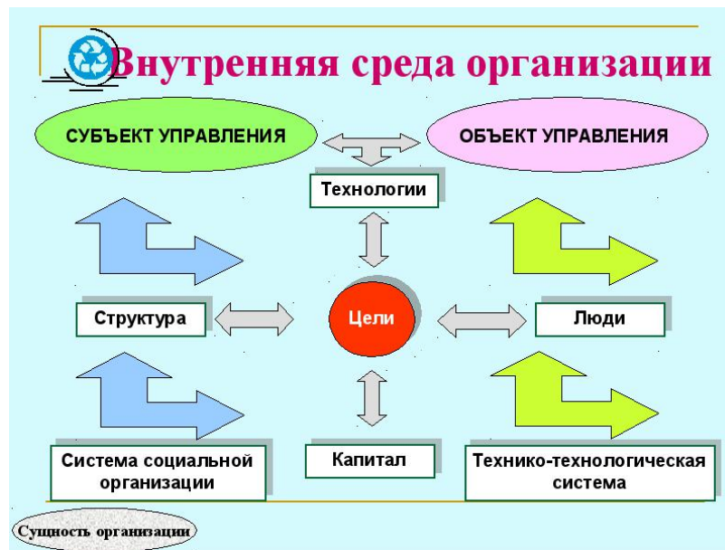
Рис.2. - Внутренняя среда организации [1]

Внешняя среда организации – это совокупность активных хозяйствующих субъектов, экономических, общественных и природных условий, национальных и межгосударственных, институциональных структур и других внешних условий и факторов, действующих в окружении предприятия и влияющих на различные сферы его деятельности [4].