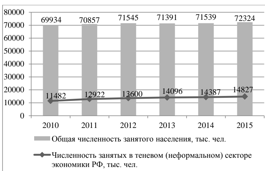
Рис. 1 - Соотношение населения, занятого в теневом (неформальном) секторе экономики РФ с общей численностью занятого населения

По данным Росстата, в теневом секторе экономики Российской Федерации сосредоточена значительная часть занятого населения. При этом, как видно на рис. 1, численность неформально занятых, начиная с 2010 г., систематически увеличивается. По нашим расчетам, доля неформально занятых в общей численности занятого населения России в период с 2010 по 2015 гг. увеличилась с 16,4 % до 20,5%.