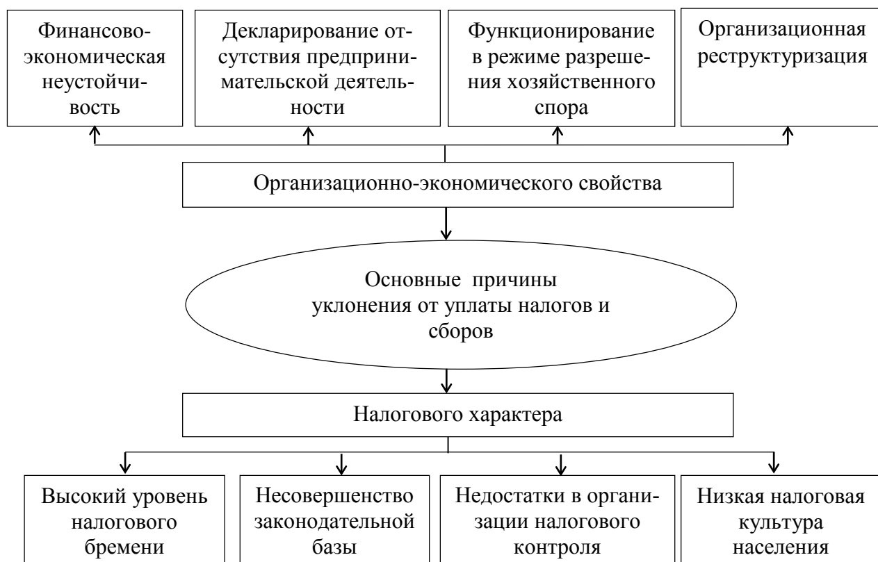
Рис. 2 – Основные причины уклонения от уплаты налогов и сборов

Налоговые риски являются неотъемлемой частью современной налоговой системы, однако в НК РФ отсутствуют упоминания об этом понятии. Налоговый риск – это вероятность возникновения в процессе налогообложения для субъекта налоговых правоотношений финансовых и других потерь, вызванных изменением, несоблюдением, незнанием налогового законодательства, а также его недостаточной правовой проработкой.