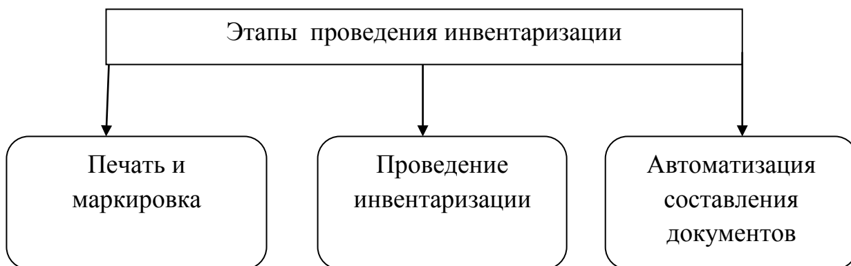
Рис.2- Этапы проведения инвентаризации

Для учета основных средств и материальных ценностей, была разработана программа, базирующаяся на штриховом кодировании. Процесс автоматизированной инвентаризации состоит из трех этапов (рис.2).