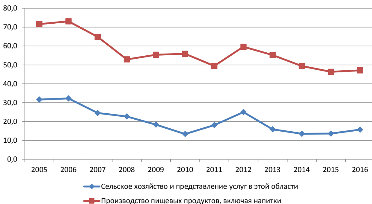
Рис.2 - Доля инвестиций в машины, оборудование и транспортные средства в общем объеме инвестиций в основной капитал, направленных на реконструкцию и модернизацию по видам экономической деятельности «Сельское хозяйство и представление услуг в этой области» и «Производство пищевых продуктов, включая напитки» в Российской Федерации за 2005-2016 гг. (в %)

Что касается динамики инвестиций в машины, оборудование и транспортные средства в общем объеме инвестиций в основной капитал, направленных на реконструкцию и модернизацию предприятиями АПК и сельского хозяйства, то здесь падение объемов еще больше (см.рисунок 2, составлено автором по [9]).