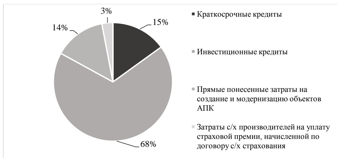
Рис. 2. Субсидирование агропромышленного комплекса

По данным АО «Россельхозбанк», ПАО «Сбербанк», АО «Газпромбанк», АО «Альфа-Банк», соотношение выданных на развитие агропромышленного комплекса краткосрочных и инвестиционных кредитных ресурсов, за 2016 год составило 75:25, в том числе в растениеводстве – 73:27, в животноводстве – 66:34. Данная статистика свидетельствует о высокой потребности аграрного сектора страны именно в краткосрочных кредитных ресурсах. Подробнее структура предоставления кредитными организациями краткосрочных и инвестиционных кредитных средств субъектам агропромышленного комплекса в период за 2016 год представлена на рис. 2.