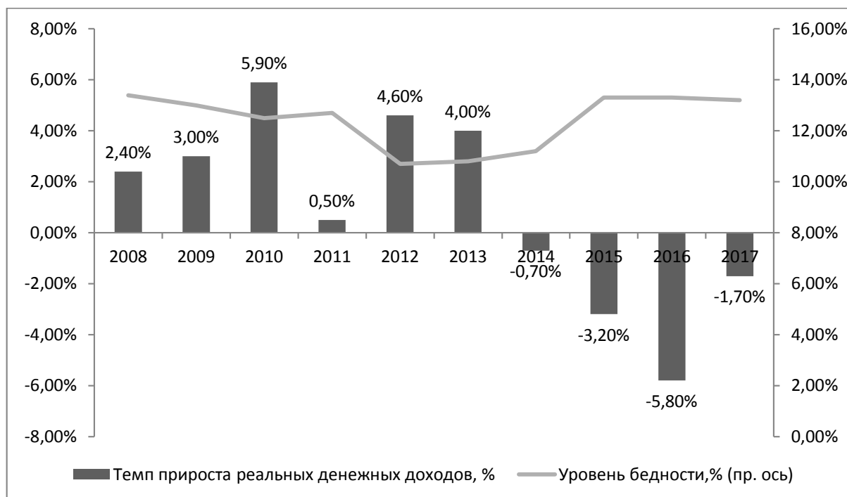
Рисунок 2. Динамика реальных денежных доходов населения и уровня бедности в РФ.