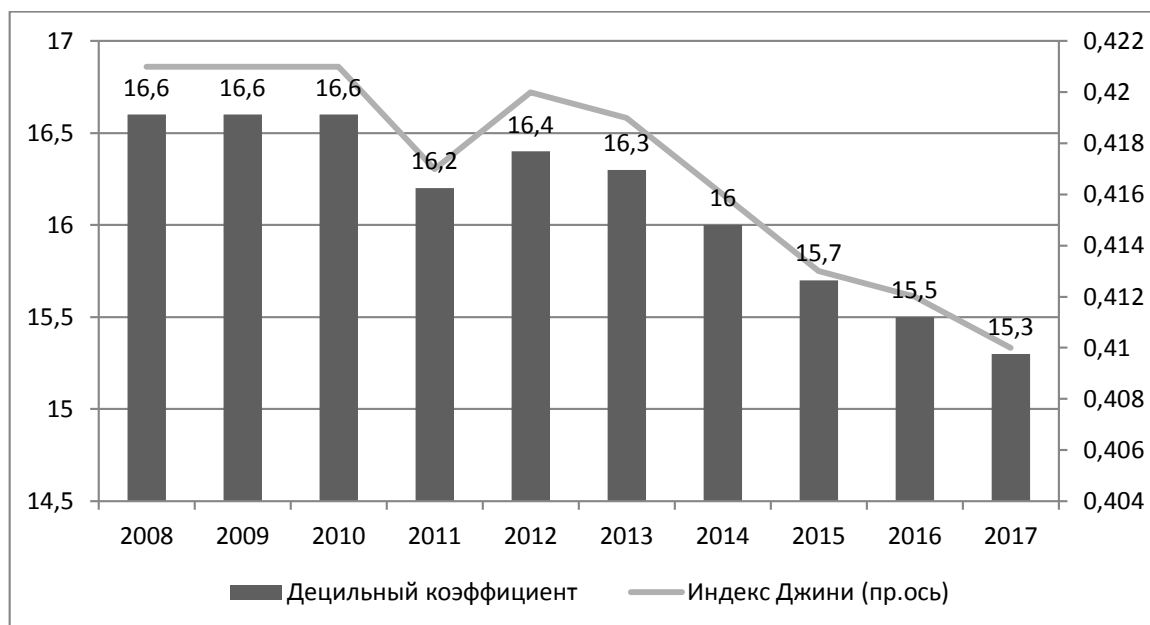
Рисунок 3. Динамика дифференциации населения по уровню денежных доходов