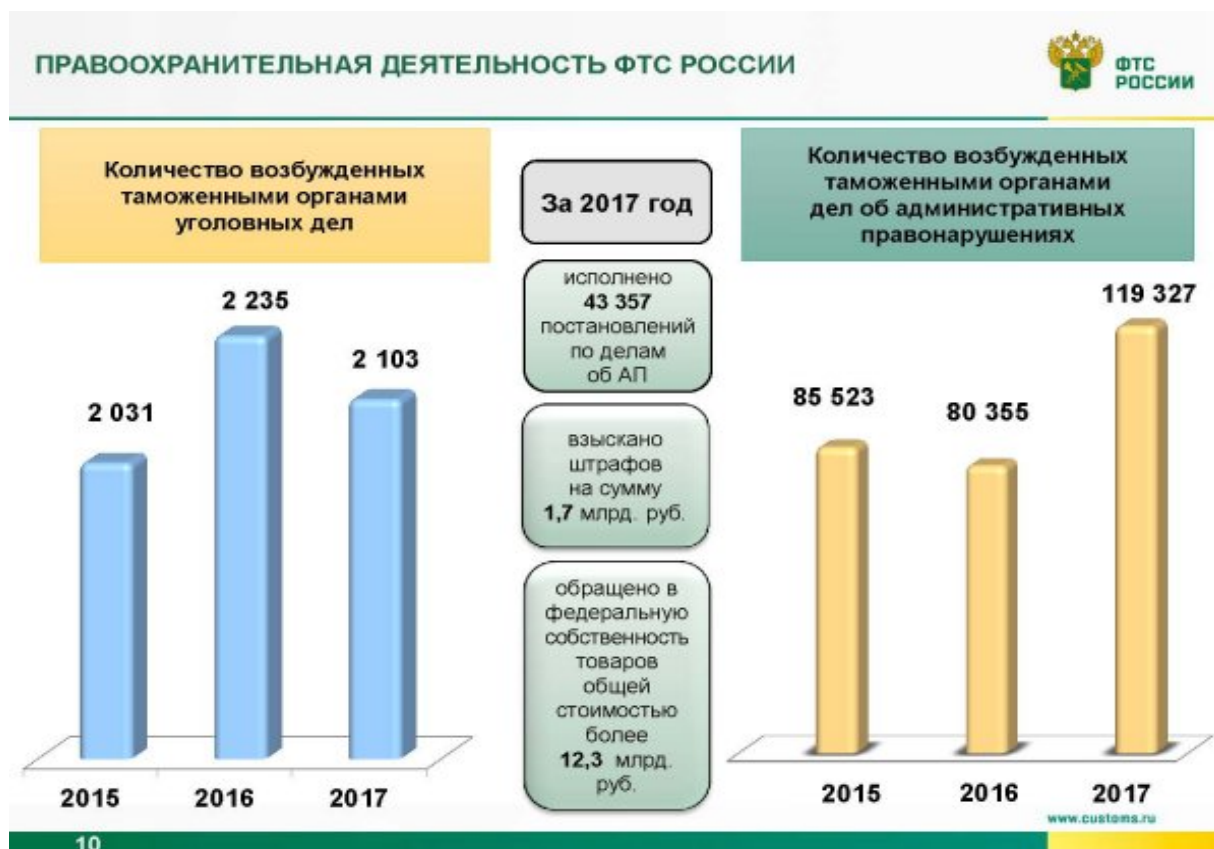
Рис. 2 - Правоохранительная деятельность ФТС России [10]

правонарушений. Все эти показатели неблагоприятно воздействуют на экономику РФ (рис. 2).