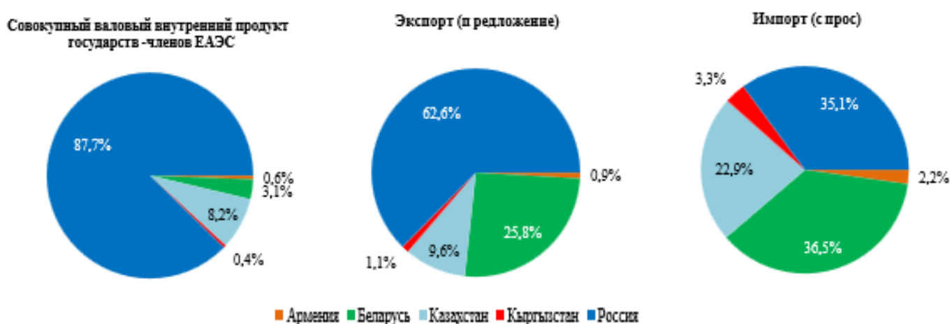
Рис. 3 – Совокупный ВВП, экспорт и импорт стран ЕАЭС [2]

Распределение по государствам - членам ЕАЭС совокупного валового внутреннего продукта (ВВП) за январь-сентябрь 2017 года, а также структуру экспорта и импорта товаров во взаимной торговле по данным за январь-сентябрь 2017 года характеризуют ниже приведенные диаграммы на рисунке 3.