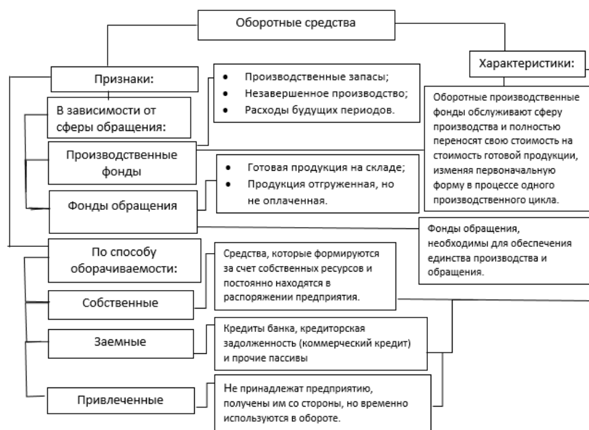
Рис.1 - Классификация оборотных средств.

Существует некая классификация оборотных средств, которая представлена на (рис.1).