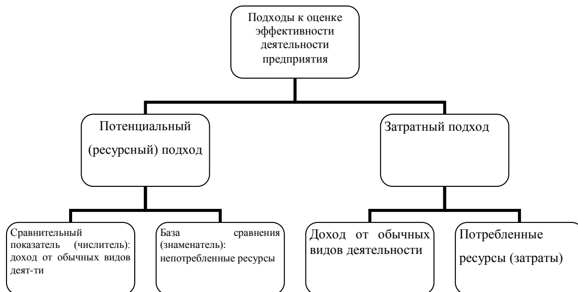
Рисунок 1 – Различия между базами сравнения

Так, Житлухина О.Г. и О.Л.Михалева выделяют потенциальный (ресурсный) и затратный подходы [4]: