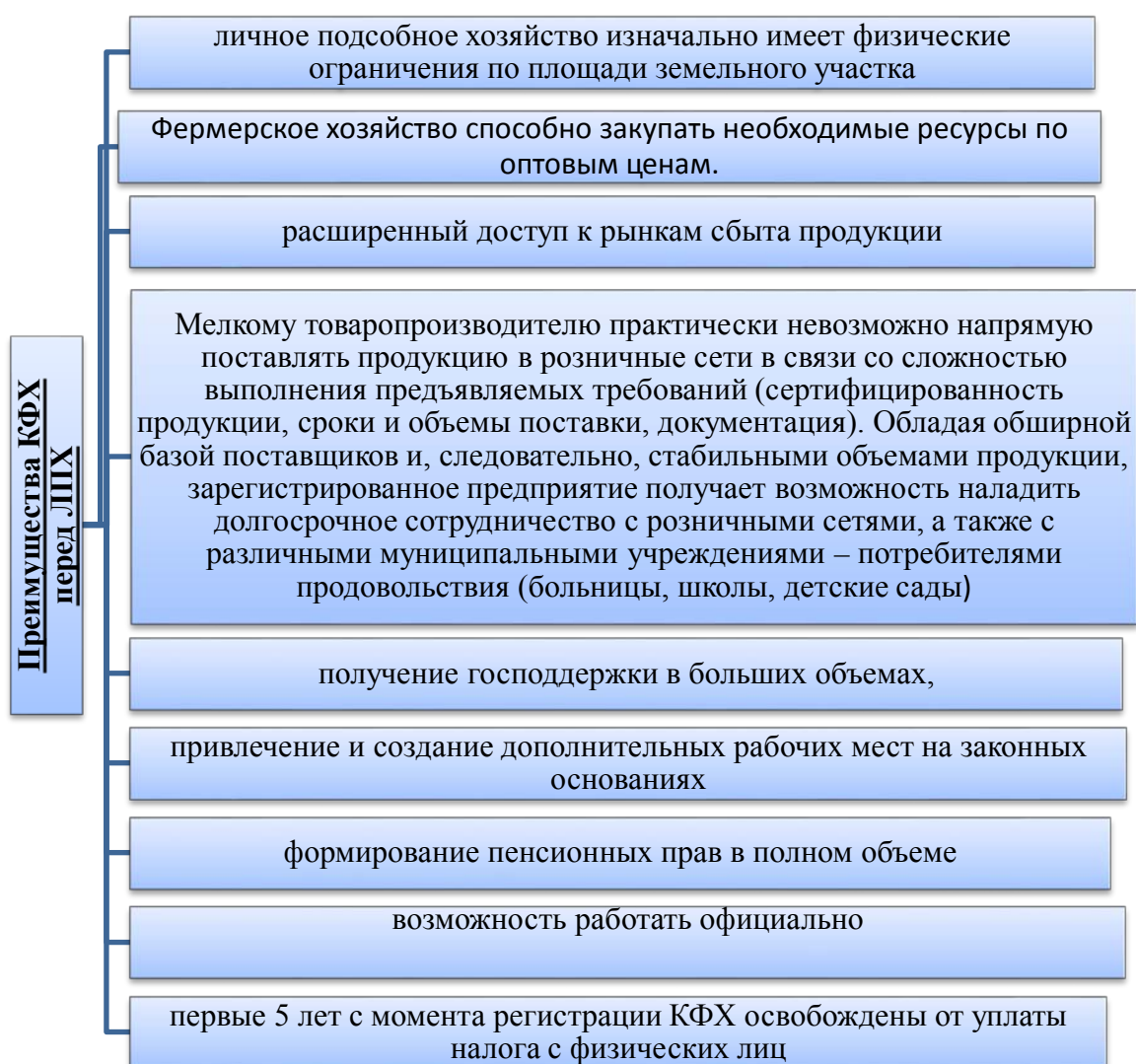
Рис..2 Преимущества КФХ перед ЛПХ

В этой связи, фермерам гораздо проще реорганизовать зарегистрированное предприятие и продолжать существовать в форме личного подсобного хозяйства. Но с точки зрения развития аграрного производства в стране и увеличения качества жизни населения КФХ имеет ряд преимуществ перед ЛПХ (Рисунок 2).