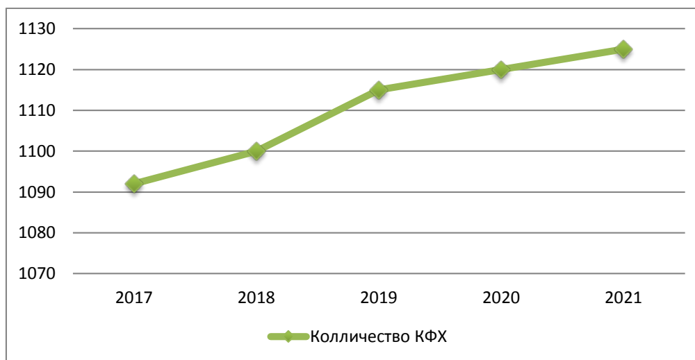
Рис.3 Прогноз развития крестьянских (фермерских) хозяйств.

Все выше перечисленное в конечном итоге приводят к увеличению прибыли непосредственных товаропроизводителей сельскохозяйственной продукции и развитию региона в целом (Рисунок3)