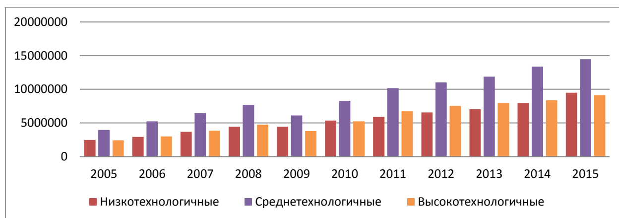
Рис. 1 - Динамика объемов отгруженных товаров собственного производства, выполненных работ и услуг собственными силами в Российской Федерации, млн. руб.

в развивающихся странах, в то время как в страны с высоким уровнем дохода демонстрируют отрицательный рост объемов производства в данных отраслях промышленности. В среднетехнологичных отраслях промышленности большее влияние на объем производства оказывает капитал и производительность труда (последняя особенно актуальная для развитых стран). В развивающихся странах основным источником роста являются природные ресурсы и энергоресурсы. Так в России в валовом объеме отгруженных товаров среднетехнологичные отрасли имеют большую долю в динамике лет (рис.1).