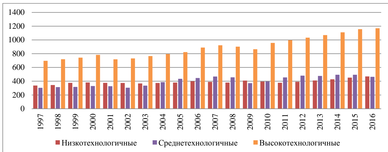
Рис.2 - Динамика добавленной стоимости в низко-, средне- и высокотехнологичных отраслях промышленности США, млрд. долл.

также демонстрирует преобладание группы высокотехнологичных отраслей. Однако, в данном случае следует отметить, что разница между группами отраслей с различным уровнем технологий не так велика. Уровень низкотехнологичных отраслей всего на 10183 млн. фунтов стерлингов меньше уровня высокотехнологичных отраслей, в то время как уровень среднетехнологичных отраслей меньше в 1,8 раза.