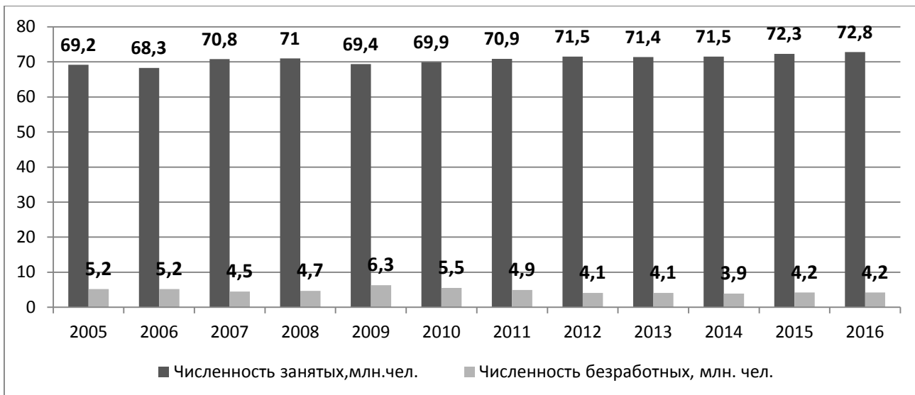
Рис.1 – Численность занятого населения и уровень безработицы в России

Далее представлена динамика уровня экономически активного населения (рисунок 2) [1]. Заметим, что категория экономически активного населения включает в себя людей в возрасте от 15 до 72 лет, занятых и безработных. Можно сказать, что это часть населения, которая предлагает свой труд на рынке труда. Экономически активное население называется также рабочей силой. [5]