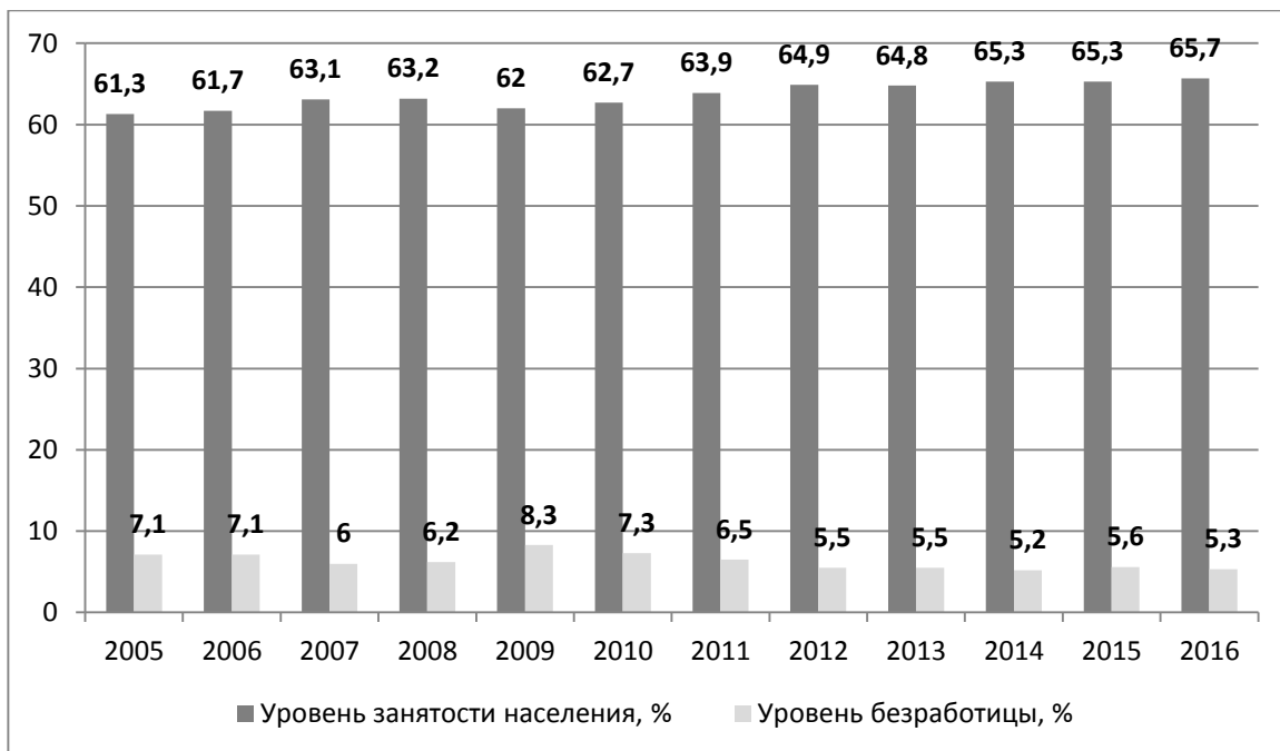
Рис.2 - Динамика уровня экономически активного населения

Далее представлена динамика уровня экономически активного населения (рисунок 2) [1]. Заметим, что категория экономически активного населения включает в себя людей в возрасте от 15 до 72 лет, занятых и безработных. Можно сказать, что это часть населения, которая предлагает свой труд на рынке труда. Экономически активное население называется также рабочей силой. [5]