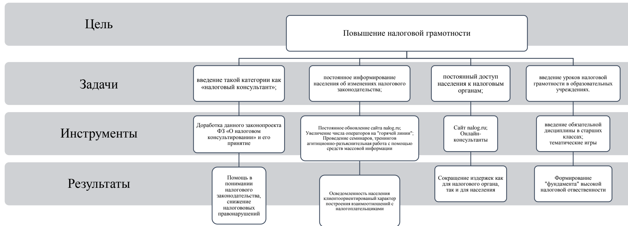
Таблица 1 – Мероприятия для повышения налоговой грамотности и их результаты

Все вышеперечисленные мероприятия и их результаты можно представить в виде следующей таблицы: