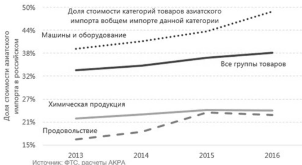
Рис 2. 49% импортируемых машин азиатского производства

Импорт потребительских товаров вырос благодаря увеличению доли ввоза продуктов питания из стран Азии, а доля одежды из Азии, напротив, упала с 67,2% в 2013 году до 61% в 2016 году.