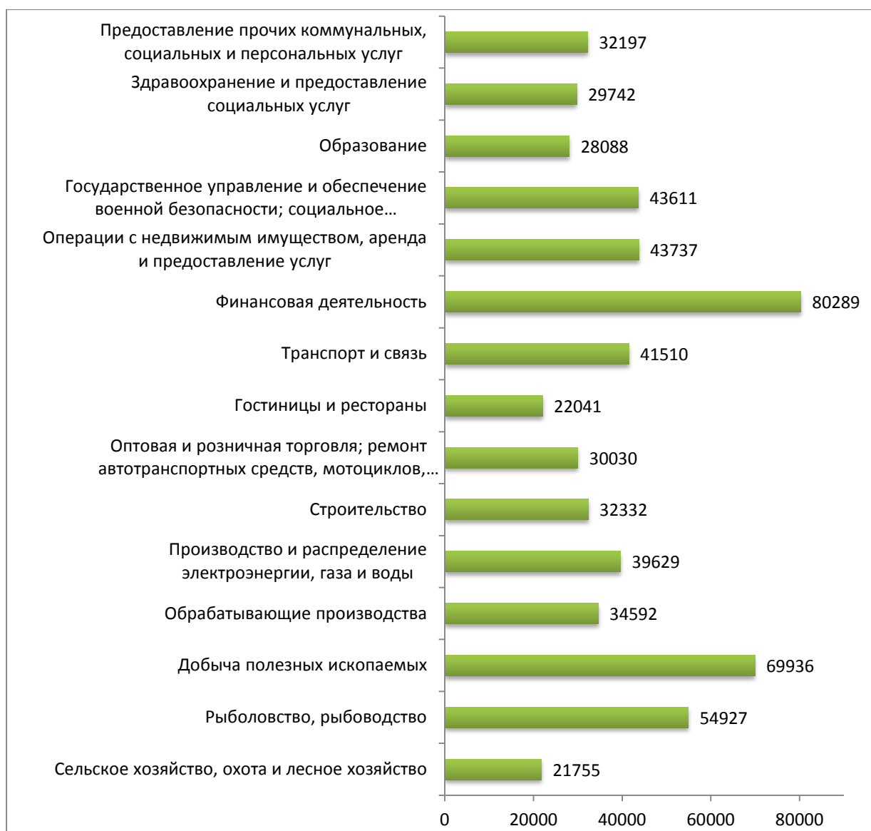
Рис. 3. Среднемесячная номинальная начисленная заработная плата в РФ по видам экономической деятельности за 2016 г., руб.[5]

Проведём исследование уровня среднемесячной заработной платы по видам экономической деятельности во взаимосвязи с уровнем занятости в данных видах (табл.1). Уровень занятости в целом по России в 2016г. равен 65,7%, при этом среди мужчин – 71,6%, среди женщин 60,4% [5, С.110]. По данным табл.1 можно выявить виды экономической деятельности, где сосредоточена занятость: оптовая и розничная торговля, ремонт автотранспортных средств, мотоциклов, бытовых изделий и предметов личного пользования (18,9%), обрабатывающие производства (14,2%), операции с недвижимым имуществом, аренда и предоставление услуг (9,9%), строительство (8,6%), транспорт и связь (8,3%), образование (7,7%), сельское и