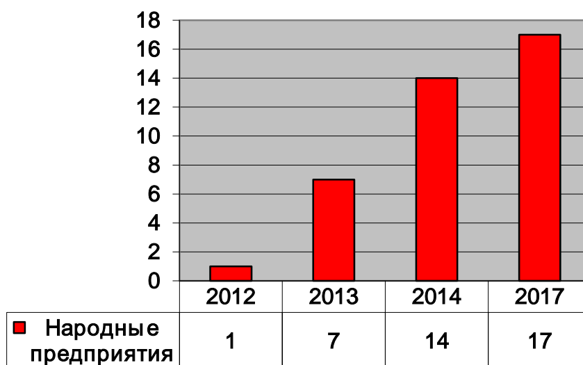
Рис. 1. Динамика роста народных предприятий в Липецкой области.

народных предприятий и закрытых акционерных обществ. Эта подпрограмма способствует росту численности работников народных предприятий.[2]