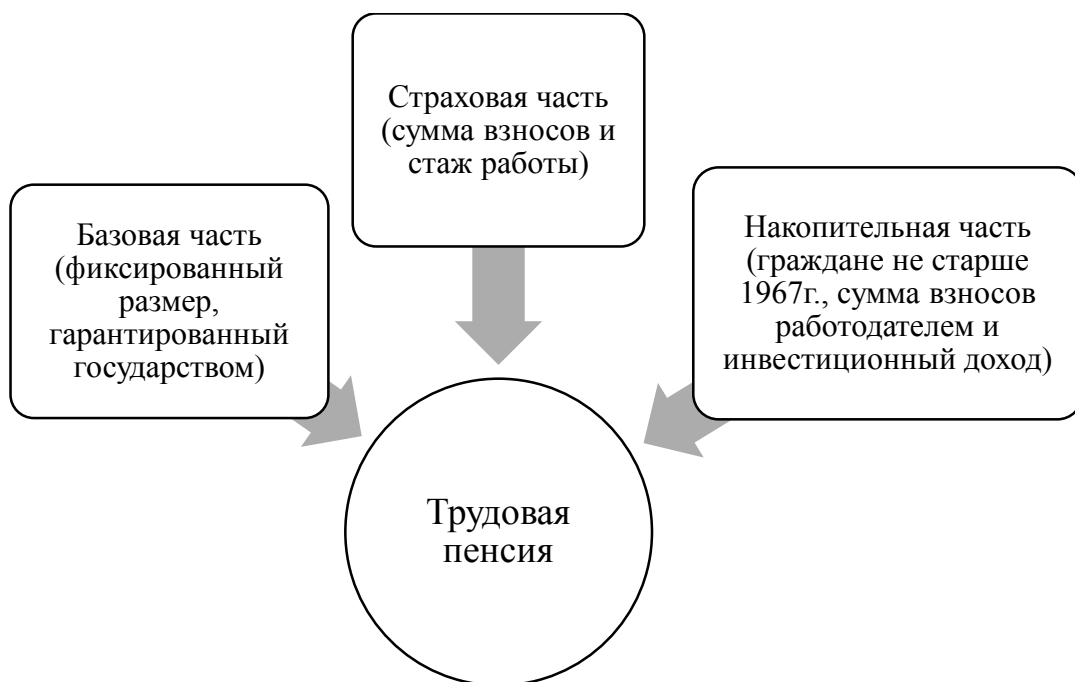
Рисунок 2. Состав трудовой пенсии

Согласно реформе 2002 г., работодатель уплачивал налог 26% от размера зарплаты сотрудника (Рисунок 3) [7].