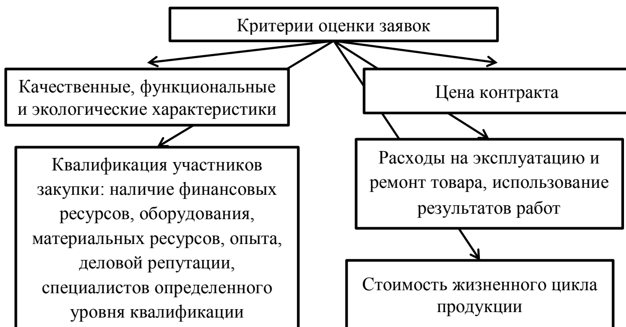
Рис. 2. Критерии оценки заявок, утвержденные Законом №44-ФЗ [1, ст. 32]

К претендентам на заключение госконтракта выдвигаются следующие основные требования: