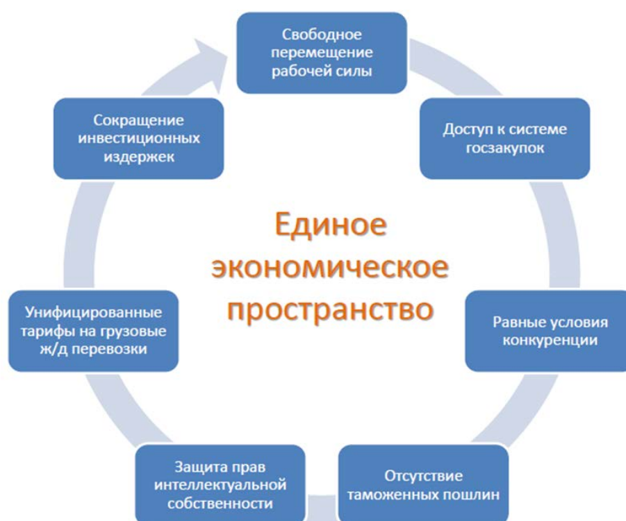
Рис. 1 – Принципы Единого экономического пространства [4]

Направлением появившейся интеграционной организации стало повышение эффективности взаимодействия и развитие сотрудничества (рис.1).