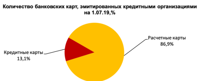
Рисунок 2 – Структура расчетных и кредитных карт, эмитированных кредитными организациями на 01.07.2019 г. [6]

Рассмотрим структуру расчетных и кредитных карт, эмитированных кредитными организациями. Анализ статистических данных на 01.07.2019 г. показал, что в процентном соотношении преобладают расчетные карты (86,9%), а кредитные карты составляют 13,1% (рис. 2).