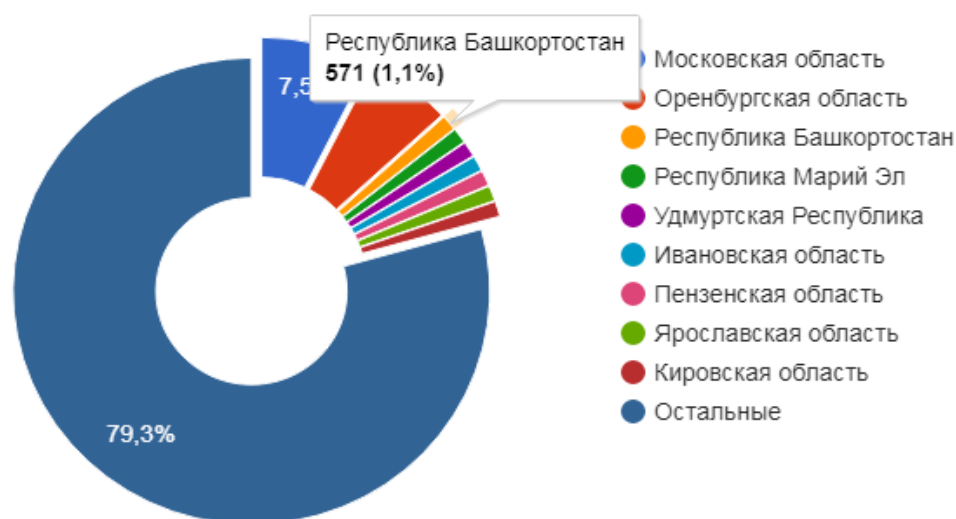
Рис. 2 - Вакансия Реставратор в субъектах России [1]

Такое положение дел можно объяснить отсутствием учебных заведений, занимающихся подготовкой специалистов в данной сфере, дефицитом специальных фирм, а также низким уровнем заработной платы.