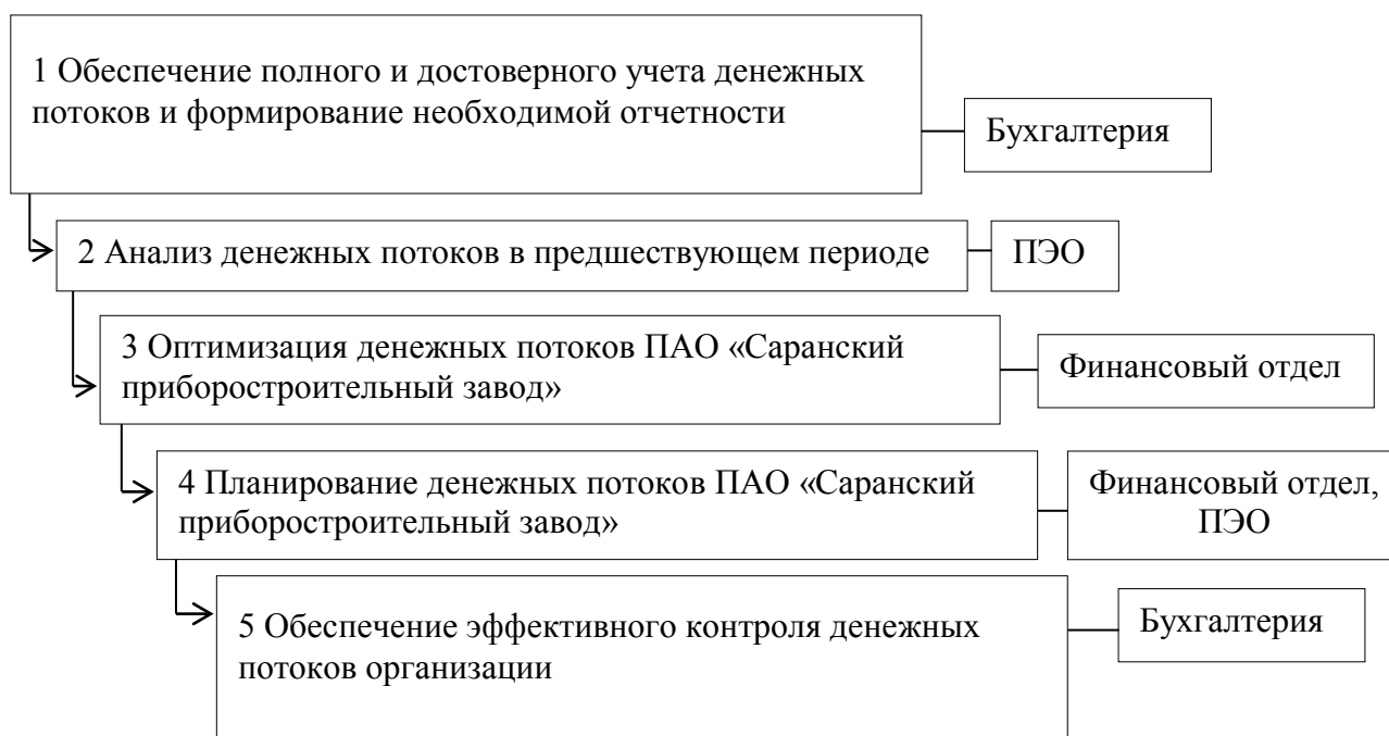
Рисунок 2 – Механизм управления денежными потоками на ПАО «Саранский приборостроительный завод» в 2019 году [3]

Как видно из рисунка 2.3 в процессе управления денежными потоками предприятия задействованы все подразделения финансовой службы завода, что в свою очередь повышает эффективность управленческого процесса, так как обязанности за контролем и движением денежного потока приборостроительного завода выполняются службами в строгой иерархии и при обнаружении несоответствий или неточностей тут же вносятся коррективы.