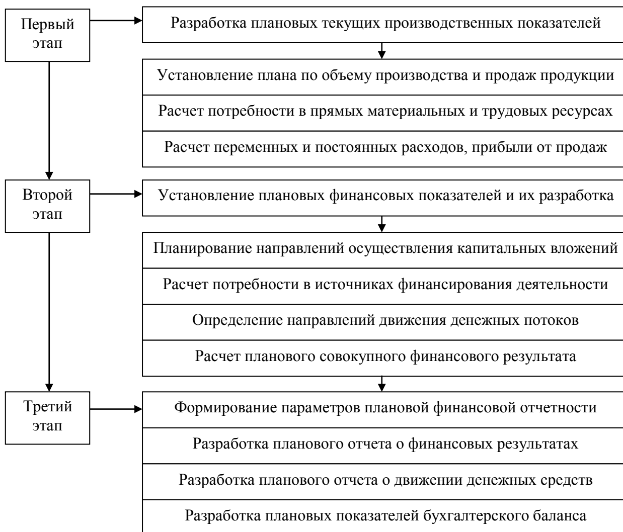
Рис. 2 – Основные этапы разработки финансового плана предприятия

По данным рисунка 2 видно, что процесс финансового планирования на предприятии, как правило, происходит в три взаимосвязанных этапа.