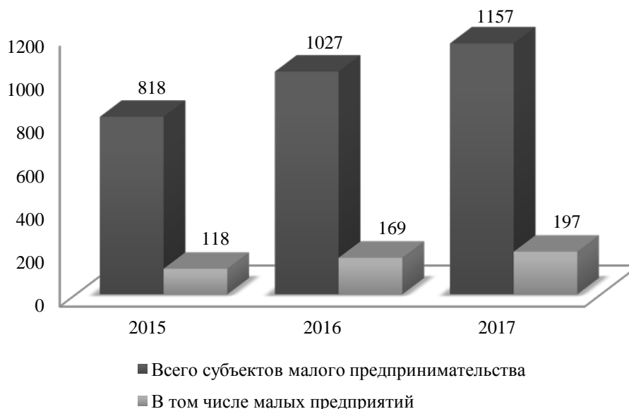
Рис. 2. – Динамика числа субъектов малого предпринимательства

В последние годы стали возрождаться традиционные для района ремесла такие, как производство изделий художественной ковки, гипсовой игрушки и керамических изделий. Освоен выпуск новых видов продукции: сухих строительных смесей, стеклоарматуры, картона, клееного бруса, дверных блоков, текстильных изделий, переработка железобетонных шпал и производству щебня в 4-х фракциях.