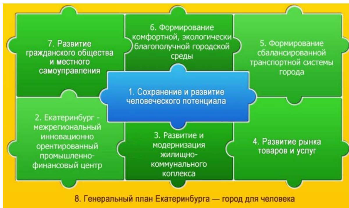
Рисунок 1 - Стратегический план развития Екатеринбурга

свободной и безопасной культурно-творческой самореализации горожан.