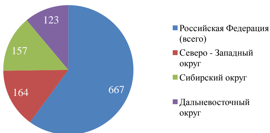
Рис. 2 – Статистика преступлений в сфере внешнеэкономической деятельности за 2018 год