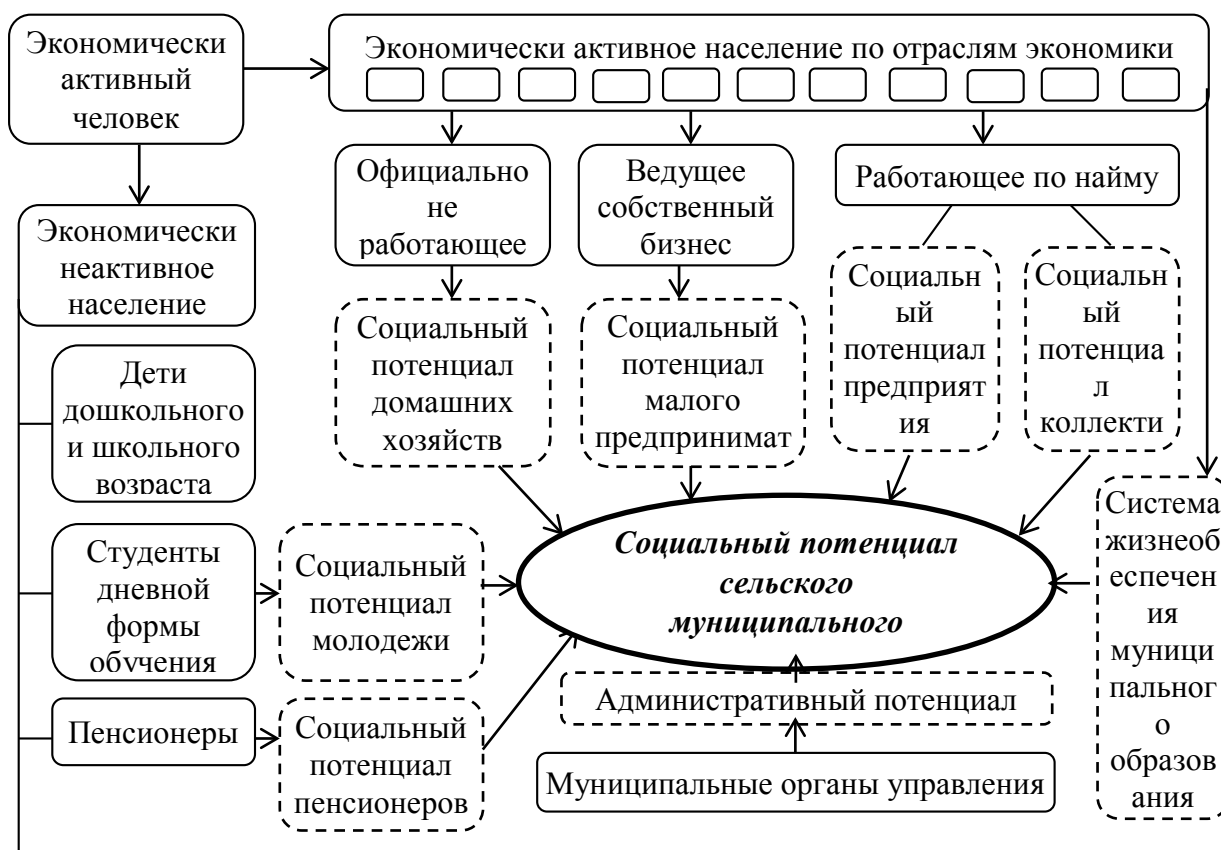
Рис. 1 – Структура социального потенциала муниципального

Социальный потенциал сельского муниципального образования следует рассматривать как совокупность потенциалов личности (жителя), из чего формируются социальные потенциалы различных групп населения, наиболее значимыми из которых следует считать работающих, молодежь и пенсионеров, предпринимательский потенциал, включающий потенциалы личности руководителя, коллектива и предприятия в целом, административный потенциал органов муниципального управления и систему жизнеобеспечения (рисунок 1) [1; 2; 3].