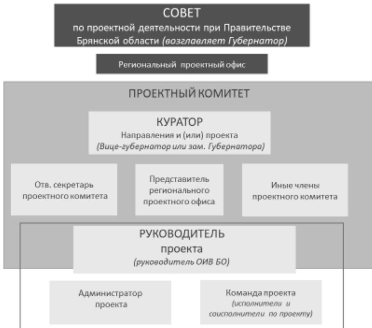
Рис.1 – Организационная структура управления проектами Брянской области [9]

проектной деятельностью Брянской области осуществляет не только Региональный проектный офис, а также Совет по проектной деятельности при Правительстве Брянской области.