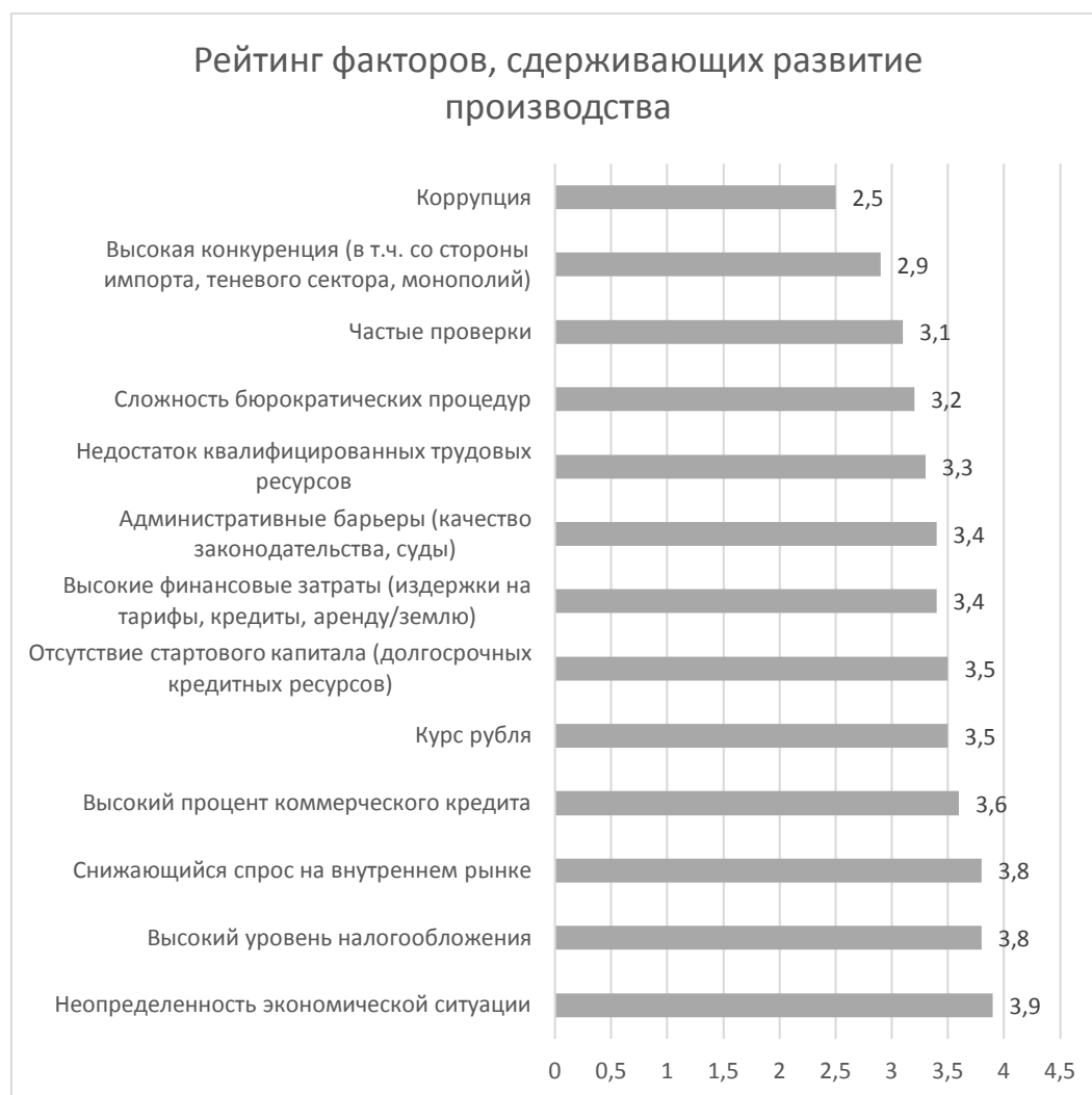
Рис. 3 - Рейтинг факторов с точки зрения оказания сдерживающего влияния на развитие производства (оценка по пятибалльной шкале)

Выделим факторы, которые ограничивают развитие сектора МСП. Всероссийский центр изучения общественного мнения (ВЦИОМ) провел опрос предпринимателей с целью выявления наиболее значимых проблем ведения хозяйственной деятельности (рис. 3).