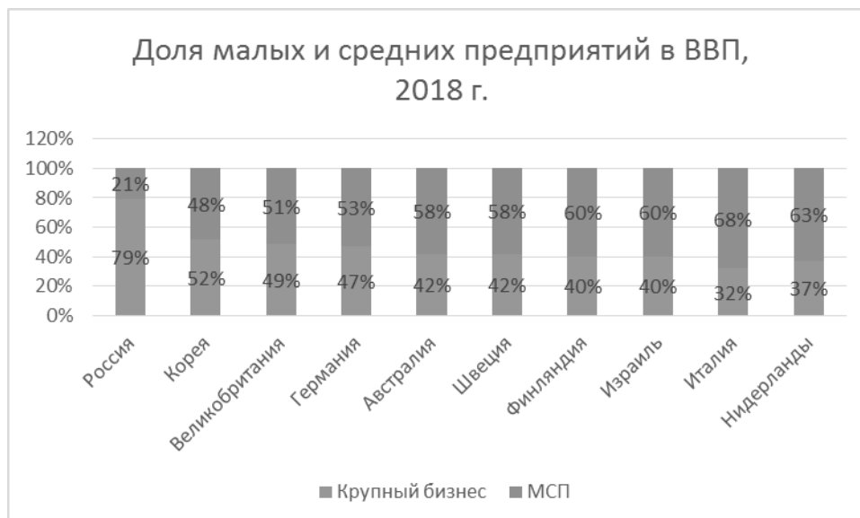
Рис. 1 - Доля малых и средних предприятий в ВВП, 2018 г.

Состояние сектора МСП различается в разных федеральных округах РФ. Абсолютное количество субъектов МСП не сможет отразить степень проникновения малого и среднего предпринимательства в экономику федеральных округов, поэтому состояние сектора МСП в федеральных округах представлено с помощью показателя численности работников, занятых в субъектах малого и среднего предпринимательства (рис. 2).