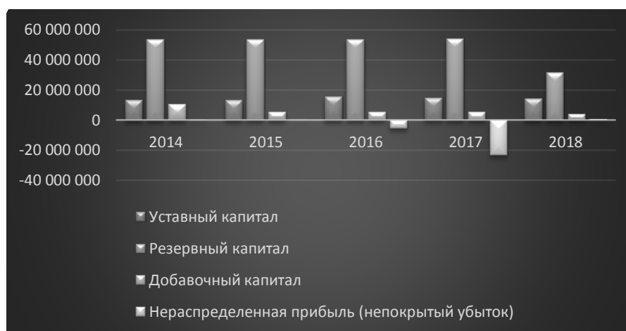
Рис. 2. Динамика состава собственного капитала в НП ЗАО «Электромаш» за 2014-2018 годы

свидетельствует об уменьшении потенциальностей экономического субъекта для исполнения расширенного воспроизводства и расценивается как негативный результат его деятельности. В НП ЗАО «Электромаш» величина резервного капитала расходуется, главным образом, на покрытие долгов и погашение убытков. Величина резервного капитала в 2018 году, в свою очередь, уменьшилась на 22 502 143 руб. и составила 31 527 599 руб. В 2016 году величина резервного капитала, в свою очередь, осталась неизменной, что связано с тем, что на предприятии не было прибыли и резерв не создавался. Модификации в составе собственного капитала предприятия за 2014-2018 годы, в свою очередь, представлены на рисунке 2.