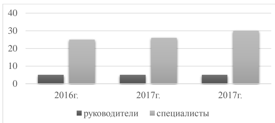
Рис. 1 – Динамика численности персонала ООО «Вилсон», %

На протяжении с 2016 по 2018 наблюдается тенденция роста среднесписочной численности персонала ООО «Вилсон» (рис. 1).