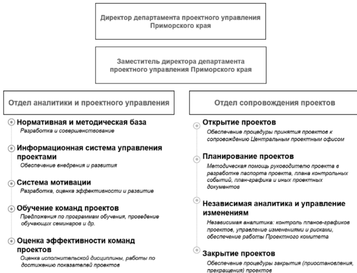
Рис. 1 – Организационная структура управления проектами Приморского края

Рассмотрим основные преимущества Регионального проектного офиса в качестве самостоятельной структурной единицы: принципиальное управление возможностями и рисками; объективный ИТ мониторинг; персональная мотивация и ответственность; встраивание в федеральную систему; упрощенная система согласования; единые увязанные приоритеты и цели; концентрация не на процессе, а на результате.