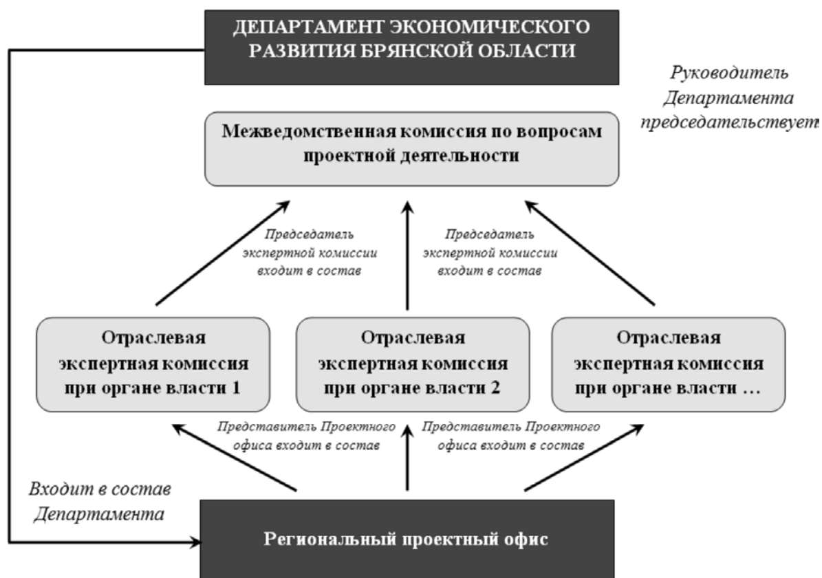
Рис. 2 – Предлагаемая организационная структура Межведомственной комиссии по вопросам проектной деятельности [10]

На рисунке 2 отражена структура организации деятельности Межведомственной комиссии по вопросам проектной деятельности.