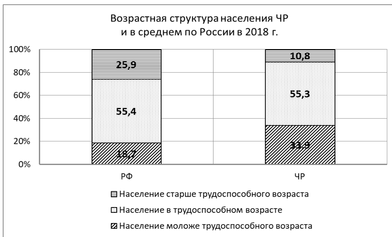
Рис. 2 – Возрастная структура населения Чеченской Республики и в среднем по России в 2018 г. Рисунок составлен авторами

Различия в динамике прироста населения, наблюдавшиеся в последние годы, привели и к существенным различиям в возрастной структуре населения в регионах и в целом по России. В настоящее время, в соответствии со шкалой демографического старения Ж. Боже-Гарнье-Э. Россега население Чеченской Республики находится в зоне «демографической молодости» - доля населения старше трудоспособного возраста чуть больше 10% по данным Росстата. В среднем по России этот показатель превышает 25%, что говорит об очень высоком уровне демографической старости.