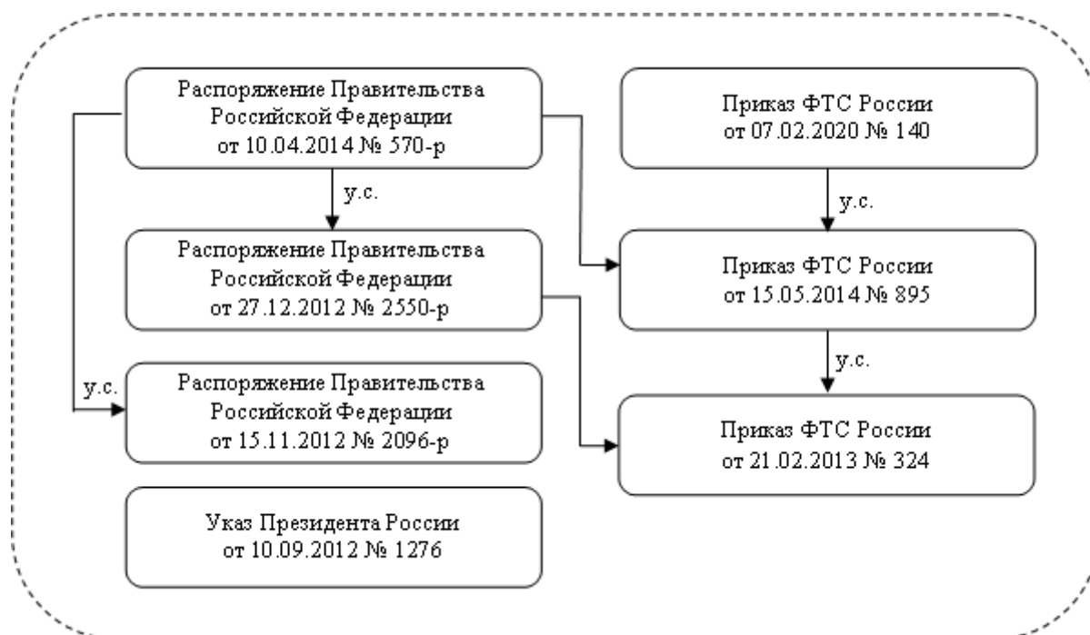
Рис. 1. Развитие системы оценки эффективности деятельности руководителя ФТС России (составлено автором)

Прежде всего, среди указанных нормативно-правовых актов следует отметить Указ Президента России от 10.09.2012 № 1276 «Об оценке эффективности деятельности руководителей федеральных органов исполнительной власти и высших должностных лиц (руководителей высших исполнительных органов государственной власти) субъектов Российской Федерации по созданию благоприятных условий ведения предпринимательской деятельности» [11], который утвердил перечень направлений для оценки, а также обязал Правительство Российской Федерации разработать совместно с АНО «Агентство стратегических инициатив по продвижению новых проектов» и ведущими предпринимательскими объединениями и утвердить перечни показателей для оценки, а также методики определения их целевых значений.