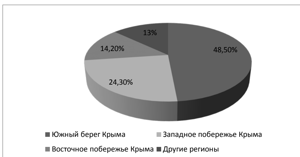
Рис. 2 – Распределение туристов по регионам Крыма с начала 2019 года

Также необходимо отметить наличие проблемы неравномерной загрузки туристско-рекреационного комплекса полуострова, что отражается в высокой загрузке размещения на Южном и Западном побережье Крыма и, соответственно, низкой загрузке других регионов. Статистика на 2019 год следующая - больше всего туристов с начала года отдохнуло на Южном берегу Крыма – 48,5% от общего количества туристов, отдохнувших с начала года в Крыму в целом, на Западном побережье Крыма – 24,3%; на Восточном побережье Крыма – 14,2%; в других регионах (г. Симферополь, Симферопольский и Бахчисарайский районы) – 13% [12]. Для более наглядного представления информации данные по распределению туристов по регионам Крыма с начала 2019 года показаны на диаграмме (рис. 2).