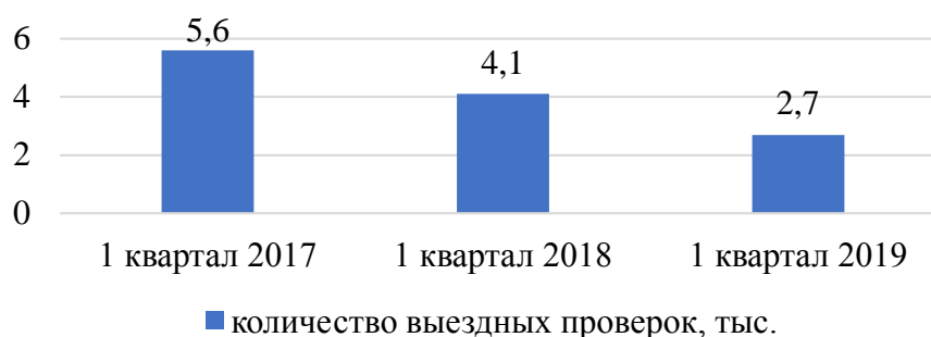
Рис. 2. Количество выездных проверок за 1 кварталы 2017-2019 гг. [6]

Процесс судебной экспертизы сопровождается исследованием документов, при этом может осуществляться с разрешения лица, назначившего экспертизу, действия необходимые для проведения экспертизы Вектор экономики | www.vectoreconomy.ru | СМИ Эл № ФС 77-66790, ISSN 2500-3666