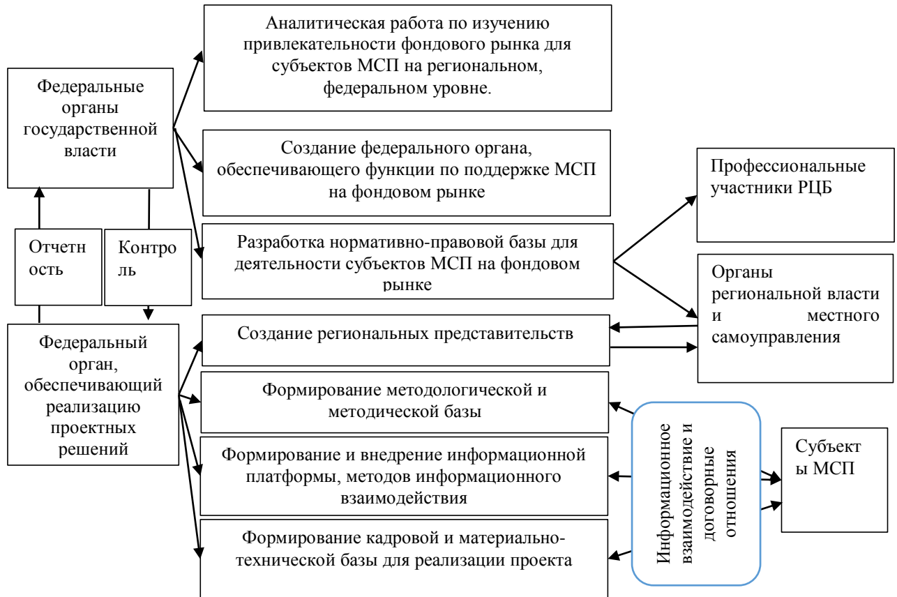
Рис.2 – Механизм поддержки участия организаций МСП на фондовом рынке