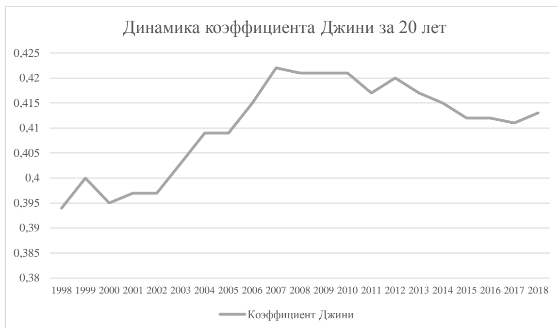
Рис. 3. Динамика коэффициента Джини 1998-2018 гг. Источник: составлено автором на основе [9, с. 1-2].

Конечно же, и 0, и 1 являются крайними величинами, которые в реальном мире, как правило, не наблюдаются. Согласно данным Росстата, Россия уже почти два десятка лет находится на уровне чуть больше 0,4, что является не таким уж и плохим показателем для столь крупной страны, однако последние данные, предоставленные Росстатом, датируются 2018 годом, и проследить, как сегодняшний кризис отразится на уровне неравенства, возможно будет лишь через несколько лет.