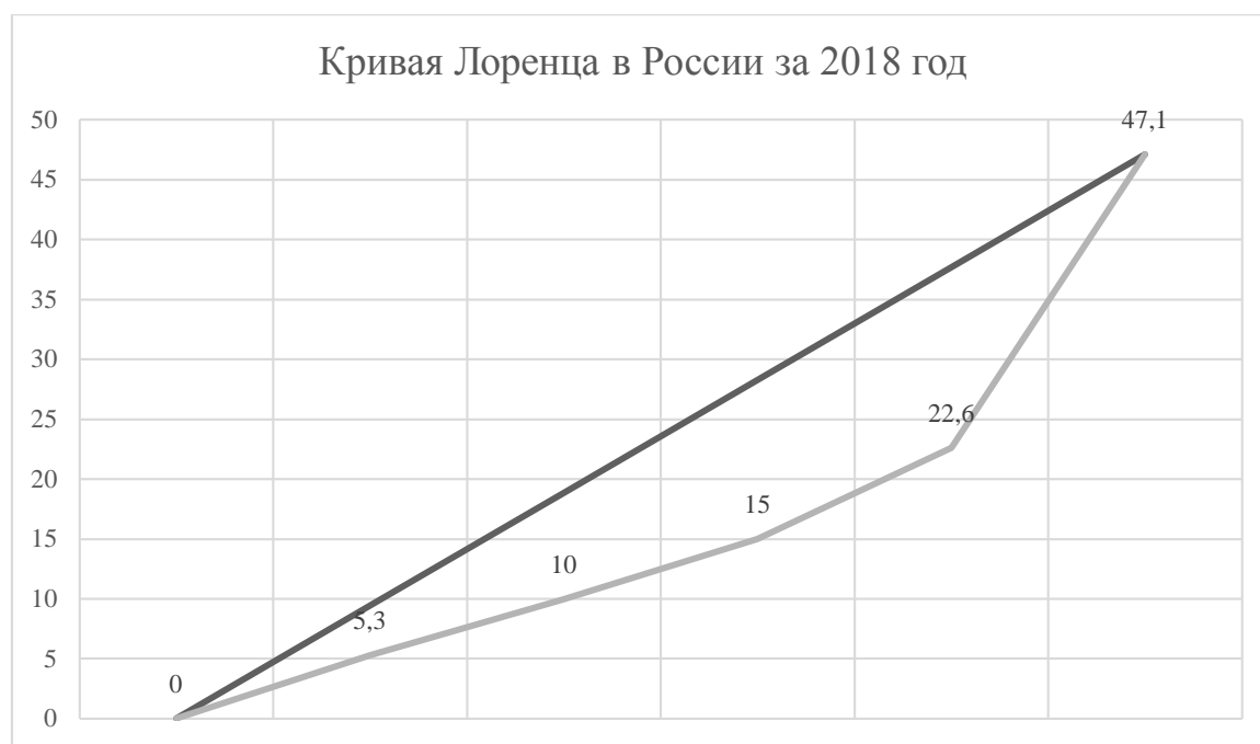
Рис. 4. Кривая Лоренца в России за 2018 год с 20% интервалом.

На следующем графике представлена кривая Лоренца и линия под углом в 45 градусов. Для иллюстрации был взят 20% интервал по группам населения. Как можно видеть, 20% россиян с наименьшими доходами получают лишь 5,3% от общего объёма денежных доходов, когда как 20% богатейших россиян получают почти половину от общего объёма – 47,1%.