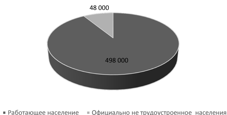
Рисунок 2 - Количество работающего населения Калужской области (в чел.)

Исходя из Рисунка, можно сделать вывод, что уровень безработицы в 2019 году резко возрос по сравнению с показателями предыдущих годов и меры по поддержке занятости являются действительно актуальными и востребованными для Калужской области. Однако данные, представленные на Рисунке 1, касаются регистрируемой безработицы, то есть учитывается количество тех, кто обратился в центры занятости населения. Такую статистику нельзя считать объективной, поскольку она не учитывает тех, кто не желает регистрироваться в качестве безработного. На Рисунке 2 представлено количество работающего населения Калужской области (население региона составляет 1 010 486 чел.).