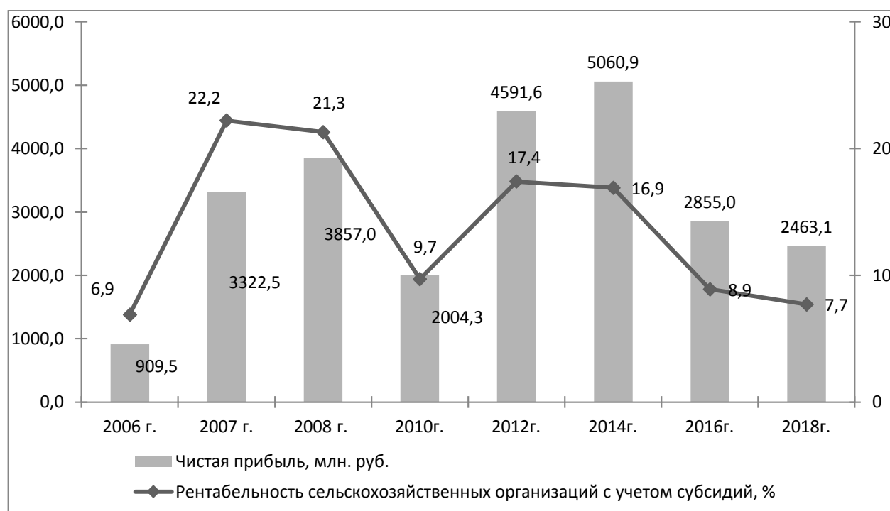
Рисунок 2- Эффективность производства сельскохозяйственной продукции региона[2, 4]

В регионе на долю сельскохозяйственных организаций приходится 44,5%, хозяйств населения – 43,4%, крестьянских (фермерских) хозяйств – 12,1% [3].