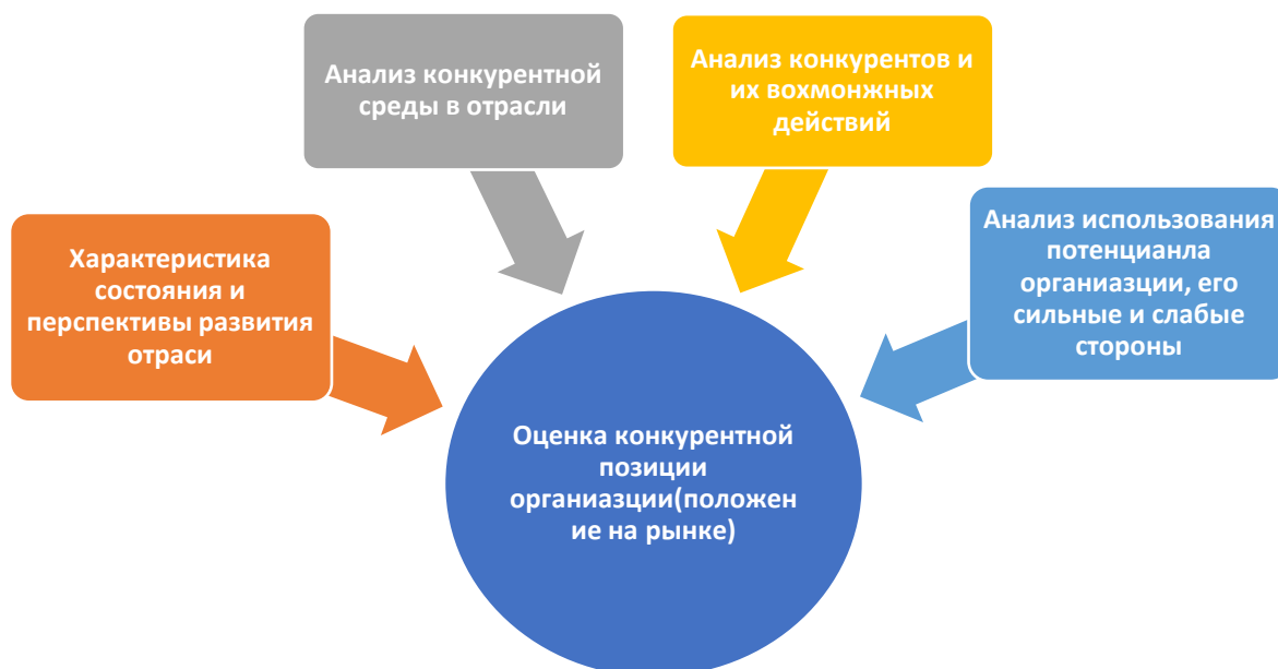
Рисунок 2 - Этапы проведения стратегического конкурентного анализа при формировании объектов стратегического учета

Важнейшими характеристиками рыночной среды, в которой функционируют сельскохозяйственные предприятия, являются: ассортимент продукции; размер захвата рынка; уровень удовлетворения потребительского спроса; перечень и структура конкурентов и покупателей; наличие барьеров входа; размер инвестиций; рентабельность.