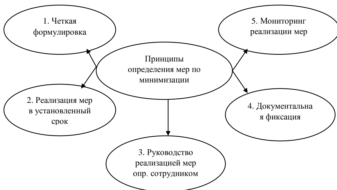
Рис.2 - Принципы определения мер по минимизации коррупционных правонарушений